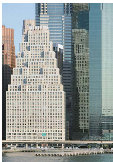
Wachsende Häuser, sinkende Steuern.

Bürgermeister Michael Bloomberg hat nun prompt reagiert und einen Einstellungsstopp für alle städtischen Be-